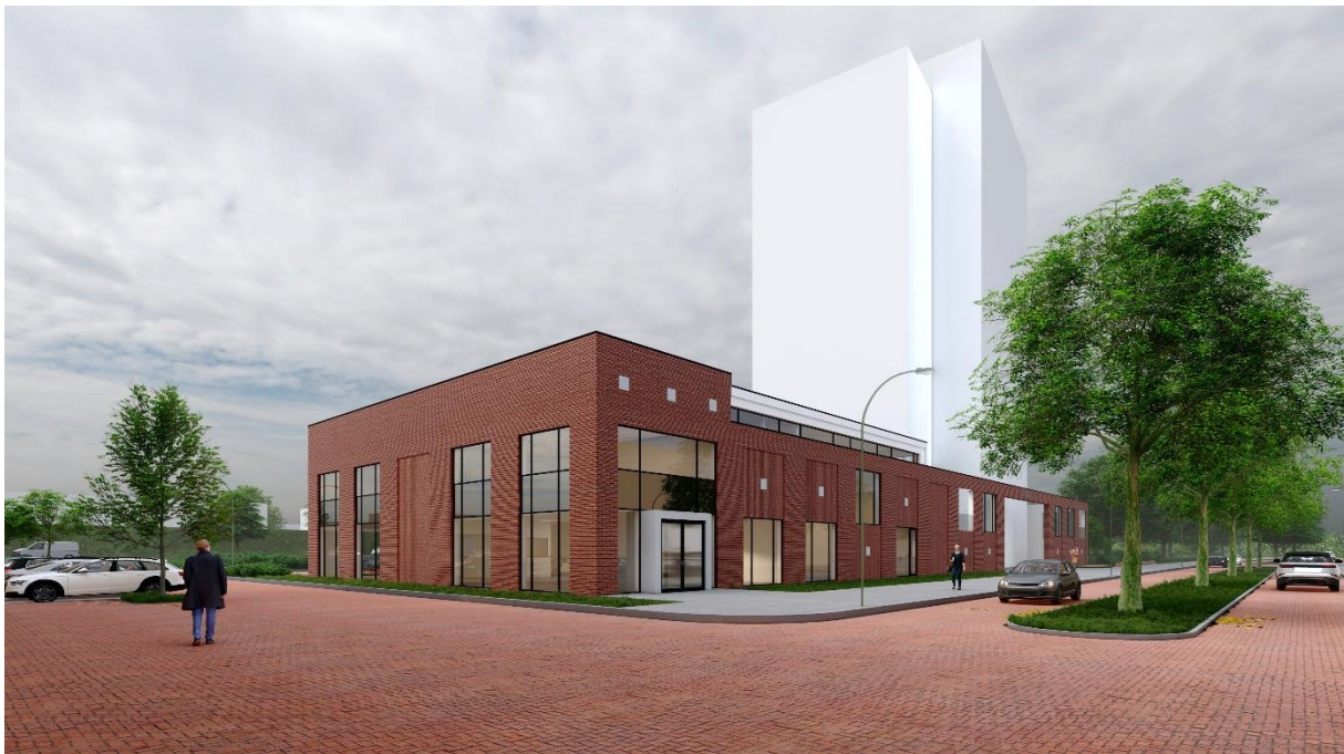
Impressie van hoe het Kerkelijk Centrum Oost eruit zou kunnen zien.

Graag informeren wij jullie door middel van deze Nieuwsflits over de stand van zaken met betrekking tot de nieuwbouw van het Kerkelijk Centrum Oost.